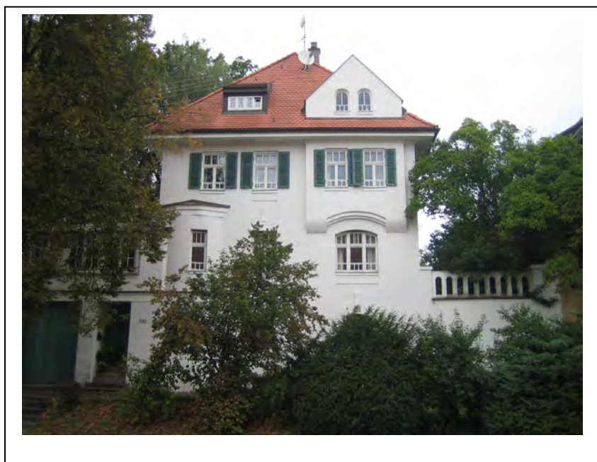
HVN, Fotoarchiv, Sept. 2006